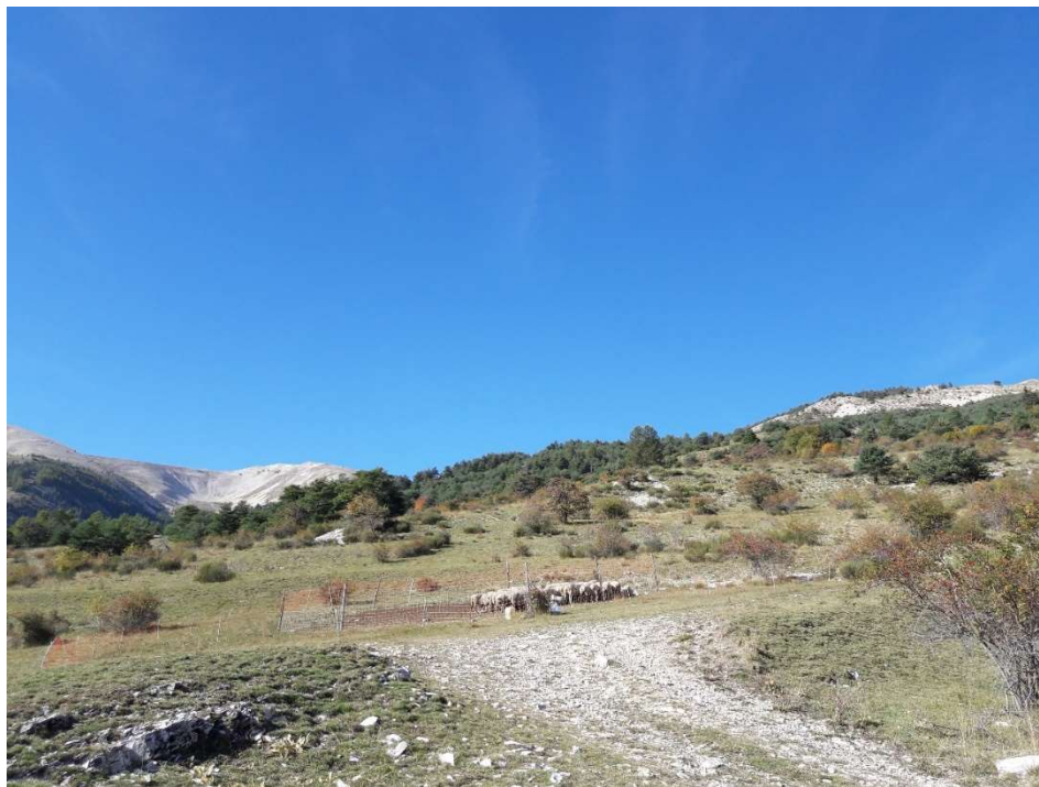
Bas de Champ Gras, le Cheval Blanc au fond - Cl. J. Eid, 21/10/18